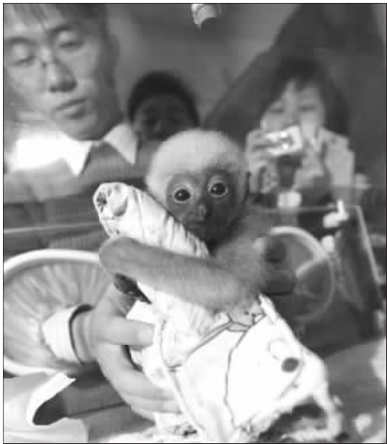
育婴箱里的“圆圆”还是挺虚弱

着笼子发现“圆圆”精神不好,左手还有伤。而“二黄”不但照顾孩子,还提着孩子受伤的手到处甩来甩去。可怜的“圆圆”疼得直叫唤,可任凭它怎么喊,妈妈也不理它。