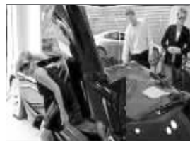
在汽车销售店试车