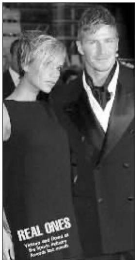
真的贝克汉姆夫妇