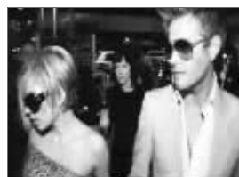
在“区域”夜总会当明星