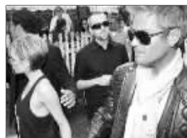
在常春藤户外饭店