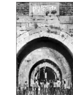
中华门。(南京京珠有文)