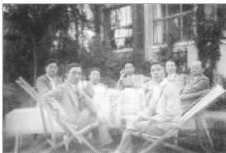
群友合影。朱偁(前右)、朱自清(前左)、冯至(后左)