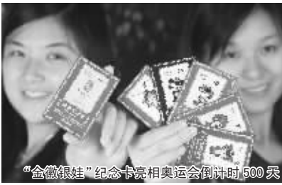
“金徽银娃”纪念套装奥运倒计时500天

业内专家特别提醒:收藏奥运纪念币要注意限量版与非限量版的区别,限量版配有国家司法机关出具的独立编号公证书以及收藏证书和国家金银制品检测报告,订购时请务必注意这些细节! 奥运标志性藏品——福娃金银纪念币国家统一发行价:5980元/套。