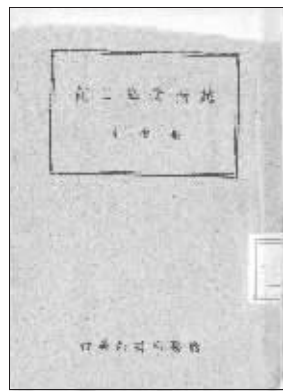
《越南受降日记》书影