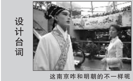
这南京咋和明朝的不一样呢