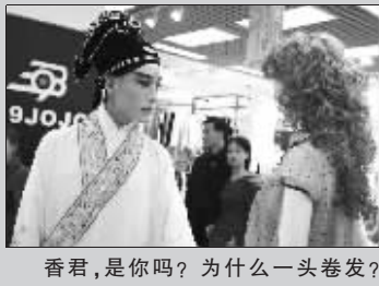
香君,是你吗?为什么一头卷发?