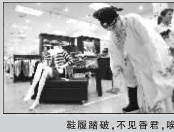
鞋履踏破,不见香君,唉