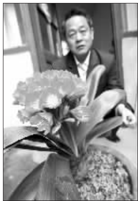
一箭开出28朵花令人称奇