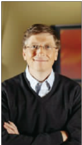
微软公司总裁比尔·盖茨

太空旅游尽管价格不菲,但对那些世界级大富翁,尤其是全球首富、微软公司总裁比尔·盖茨来说,这点钱根本不成问题,只是他们是否有这个意愿而已。日前,正在享受太空旅游的盖茨好友查尔斯·希莫尼透露说,盖茨还真的有意上天走一回。