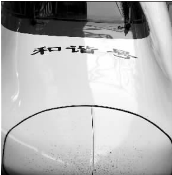
子弹头列车命名“和谐号”