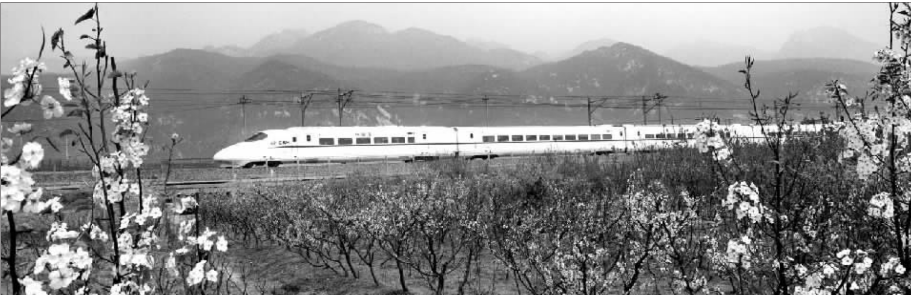
“和谐号”CRH动车组列车飞驰在京沪线上。