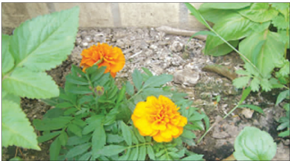
在春天，雨萱的梦想开出花来。