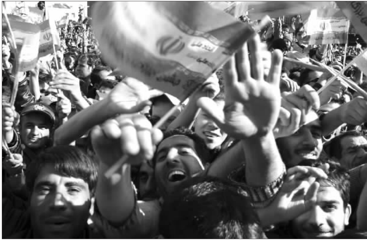
3月31日,伊朗民众在德黑兰庆祝伊斯兰共和国日