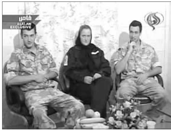
被扣押的英国水兵在录像上露面