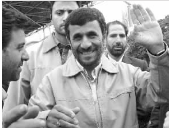
内贾德3月30日向支持者挥手示意