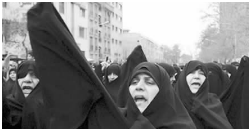
伊朗妇女3月30日在首都德黑兰街头参加反英大示威

伊朗最高领袖的一名警务代表3月30日要求伊朗政府释放被扣押的英国女水兵费伊·特尼。同日,伊朗驻英国使馆公布特尼的第三封信。但英国专家分析信件内容和措辞后认为,包括前两封信,这些信均不是出自特尼之手,而是伊朗方面炮制。