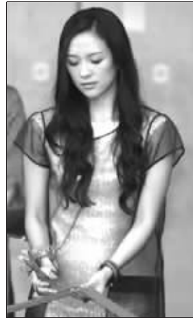
章子怡的小肚子凸显