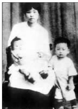
岸英、岸青与母亲杨开慧合影