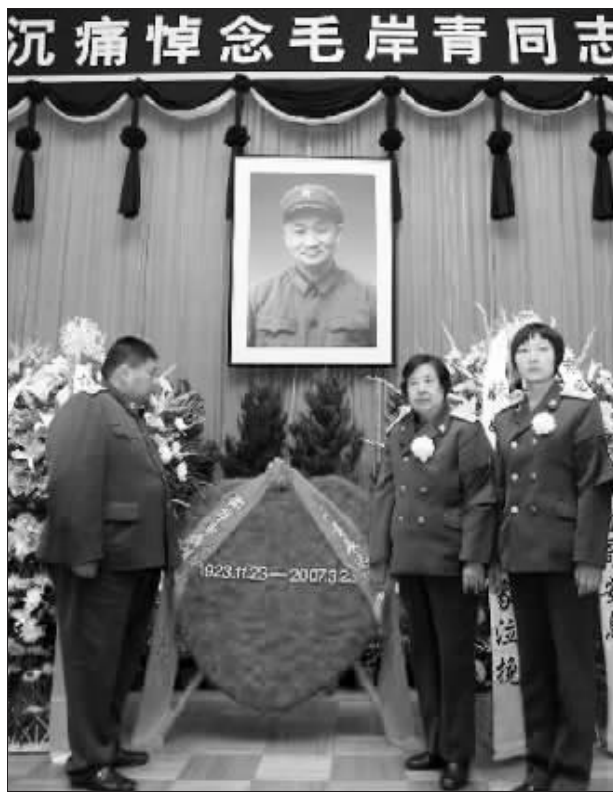
昨日,邵华(右二)和儿子毛新宇(左)、儿媳刘滨(右一)在北京的灵堂内悼念毛岸青。

新华社北京3月24日电 毛泽东主席和杨开慧烈士的次子毛岸青同志,因病医治无效,于2007年3月23日4时20分在北京逝世,享年84岁。 毛岸青1923年11月23日生于湖南长沙。1930年11月14日,杨开慧被反动军阀残酷杀害。毛岸青和哥哥毛岸英、弟弟毛岸龙三人在中共地下党组织的营救和安排下,秘密转移至上海,不久毛岸龙因病早逝。