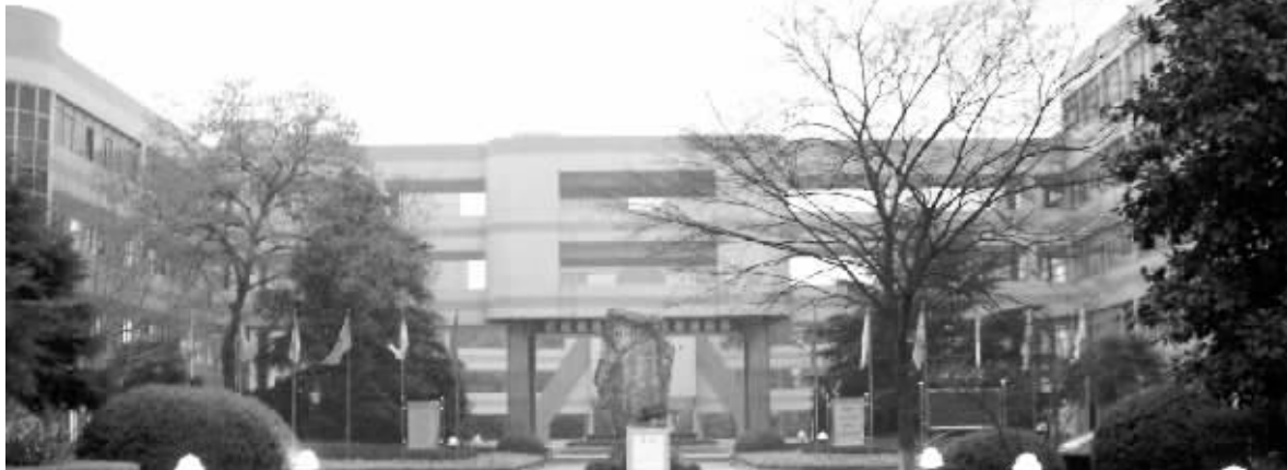
事发宜兴中学教学楼(李先生爆料奖100元)