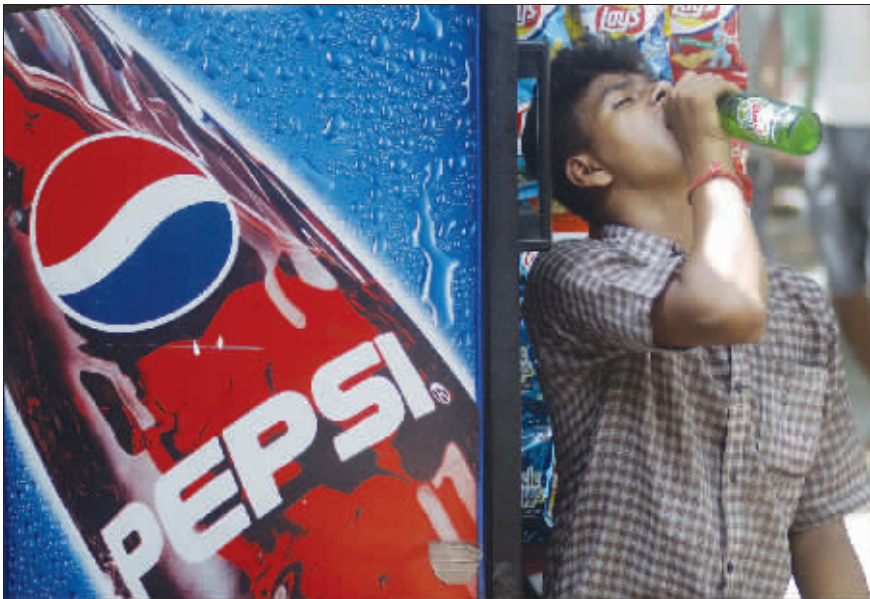
一名印度男子正在畅饮软饮料 (资料图片)

顿·罗斯说,研究发现皇冠可乐在软饮料中酸性最强,酸碱度达到2.387;樱桃可乐其次,酸碱度为2.522;可口可乐排名第三,酸碱度为2.525。酸碱度是衡量溶液酸性或碱性的度量,范围在0到14之间,数值由低到高酸性逐渐减弱,碱性逐渐增强,数值为7的为中性溶液,如常温状态的纯水。蓄电池使用的酸液酸碱度为1.0。