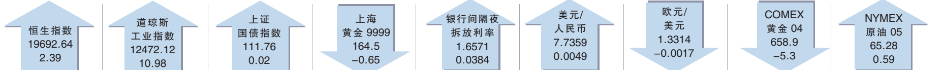
截至北京时间3月23日22:45

需要稳定的市场环境。目前,推出股指期货的工作正在积极准备当中,大盘蓝筹股的平稳运行,市场的稳定为股指期货推出创造了良好的氛围。 随着年报季报的披露,优质公司的投资价值将进一步显现,而基本面缺乏业绩支持,又无实质性重组题材的“低价”股将面临较大的调整压力,热点转换将成为市场有效突破3000点的重要因素。建议关注(1)高送转之后业绩增长保持同步甚至更快的行业龙头股;(2)随着股指期货的逐步推出,期货交易者将成为股市最大受益者,拥有期货公司的个股必将成为券商股一样成为资金关注的焦点;(3)随着封闭式基金年报序幕的拉开,封基分红潮的到来,封闭式基金的市场表现值得关注。