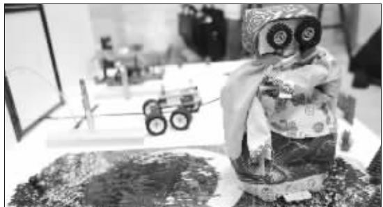
漂亮的机器人在门外把守

未来是怎样的一个生活空间？未来住宅是什么样子的？也许江苏省罗庚中学的几位中学生能给你一个答案。昨天，记者探营江苏省第十八届科技创新大赛，看到了运用太阳能和机器人这两个元素的未来住宅。记者看到，在模拟的房子里，电灯、电视机一应俱全。一个漂亮的机器人正站在门外把守。左老师介绍，“如果家里来了客人，机器人就会主动开门迎客。天黑了，机器人还会自动感应，开灯照明，如果想看电视，