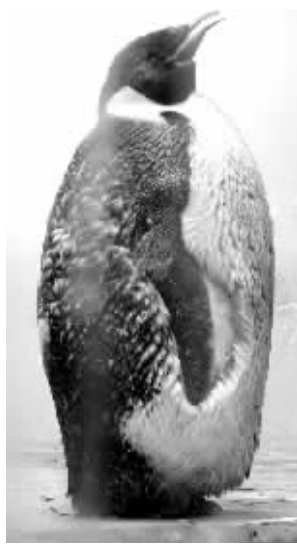
帝企鹅身上的毛掉了一大块