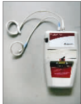
这是性功能鉴定的一个关键仪器。

2006年10月,刘某一纸诉状将陈某告上法庭,要求陈某赔偿其夫妻性权利抚恤金。后经法院调解,陈某一次性赔偿刘某人民币1.6万元。