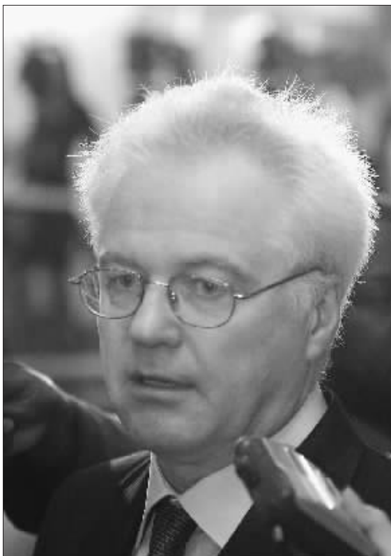
3 月 15 日,俄常驻联合国代表维塔利·丘尔金在纽约联合国总部一个新闻发布会上回答记者提问

俄罗斯常驻联合国代表维塔利·丘尔金否认俄方向伊朗发出任何通牒,表示布什尔核电站不在安理会制裁范围之列。他表示,莫斯科和德黑兰仍然在努力解决双方在布什尔核电站问题上的争执。邱永峰 王丰丰 王辉