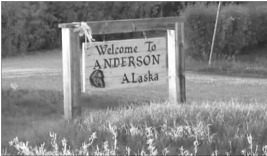
寂寞美丽的北极小镇欢迎你

都说天下没有免费的午餐,但美国阿拉斯加州内陆小镇“安德森”却有免费的地皮。这个在北极圈内的小镇人烟稀少,为了吸引新移民,他们推出了免费赠地活动,只要交纳500美元押金,就能获得一块土地。最终,从美国各地赶到的26个幸运儿抢到了移居冰雪世界的权利。