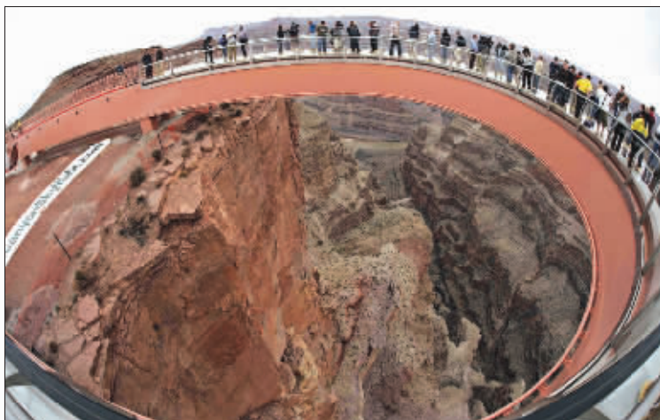
20日,参观者在“空中走廊”上欣赏大峡谷的美景

美国大峡谷空中走廊 20 日举行了揭幕典礼,77 岁的前宇航员巴兹·奥尔德林迈上了“第一步”,体验到凌空俯瞰 1200 米深大峡谷的刺激感觉。