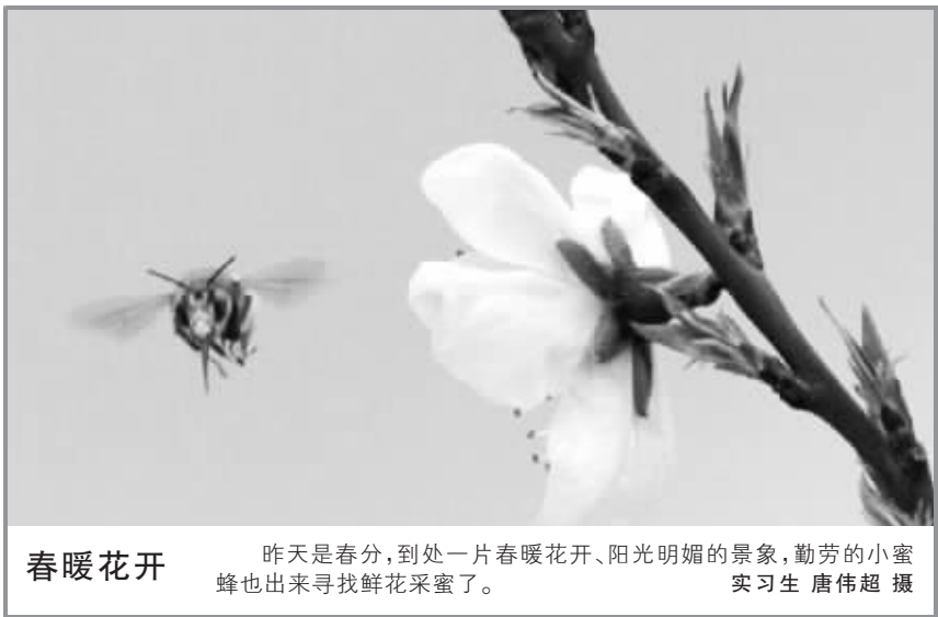
春暖花开 昨天是春分，到处一片春暖花开、阳光明媚的景象，勤劳的小蜜蜂也出来寻找鲜花采蜜了。