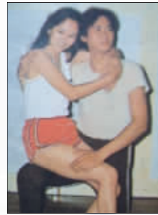
赵雅芝坐上郑少秋大腿