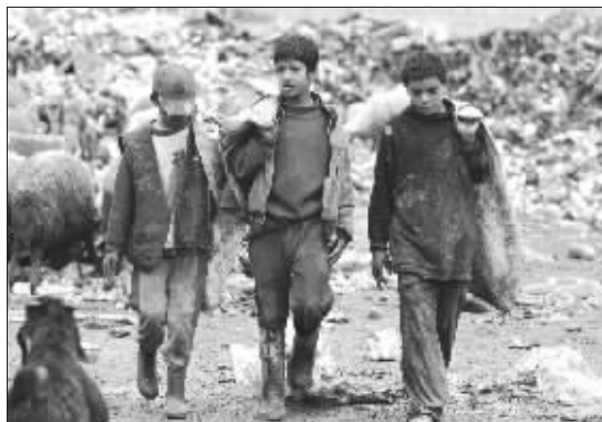
在伊拉克首都巴格达,几名拾荒的少年从一座垃圾堆走出。

但现在少年们的话题只是炸弹击中哪幢朋友的房子、哪位朋友的父亲被杀或被绑架。“他们的思想变得十分灰暗,不再去想明天,因为他们知道,明天或许永远不会来。”哈利勒任大学教授的母亲说。邱永峰