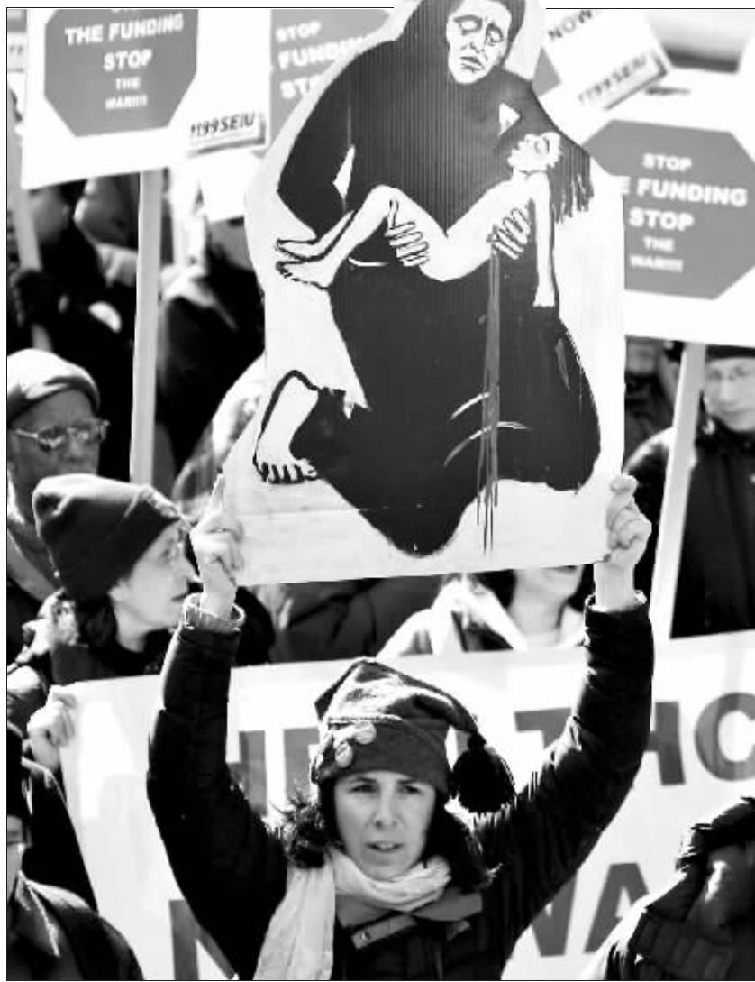
抗议者走上街头,反对布什政府发动的伊拉克战争

以美国为首的联军入侵伊拉克即将4周年了,然而那里被“解放”的人民并没有过上太平日子,各种层出不穷的暴力事件让他们终日生活在担惊受怕中。同时,遍及全美的大规模反战游行仍在继续,人们呼吁布什政府停止对这场战争的资助并立即撤军。