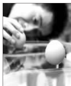
看谁能把鸡蛋立起来

快报讯(通讯员 马伟宏 记者 安莹)3月21日8时07分是二十四节气中的春分,这一天太阳将会从正东升起,正西落下。常言道“春分秋分,昼夜平分”。此时太阳光直射地球赤道,南北两半球所得到的太阳热量一样多,昼夜时间一样长,所不同的是北半球是春天,南半球是秋天。