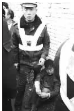
民警守护着被打的交通稽查人员

13日上午,河南郑州市西四环与中原西路交叉口北200米处,交通规费征稽人员拦车查交通规费时,被拦车辆刹车不及,造成四车追尾,一司机当场身亡。