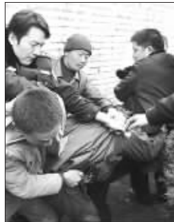
民警制止围攻交通稽查人员的群众