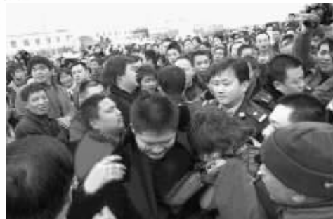
稽查人员遭围攻,一名女稽查员被民警保护起来

13日上午,河南郑州市西四环与中原西路交叉口北200米处,交通规费征稽人员拦车查交通规费时,被拦车辆刹车不及,造成四车追尾,一司机当场身亡。