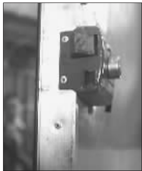
一名养狗户的门锁被弄坏

警方对此解释说,此次行动并非“打狗”行动,而是接到周围居民投诉有针对性地前往处理。到其中一户门前时听周围居民说屋内有人,但是民警敲门却无人应答,因此才撬门而入。 据《南方都市报》