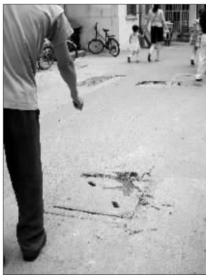
老太太被撞后的现场