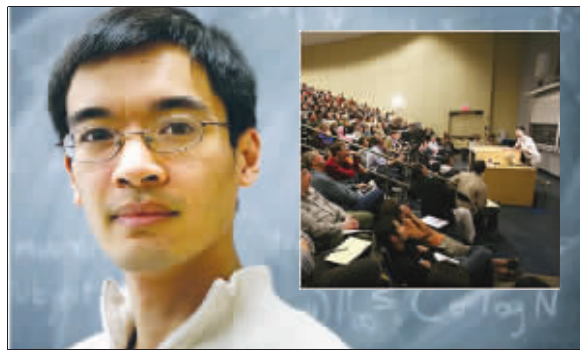
31岁的陶哲轩已成为全世界屈指可算的顶尖数学家。(小图)他在加州大学的数学讲座往人满为患, 甚至在网上直播。

2岁时就教大孩子数数, 9岁就上大学数学课程, 30岁时摘取青年数学家最高奖, 多亏父亲不愿拔苗助长