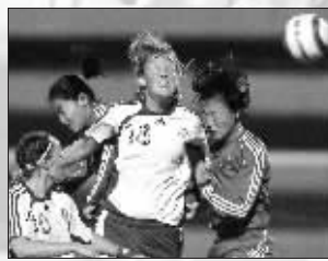
中国女足完败于芬兰队

北京时间昨晨,面对北欧球队芬兰队,中国女足以0:2完败,遭遇组队历史上最重大的打击之一。三连败,阿尔加夫杯征战史上最糟糕的战绩,让中国女足从凋零变成彻底枯萎。根据赛制,中国女足将与冰岛队争夺第九名。