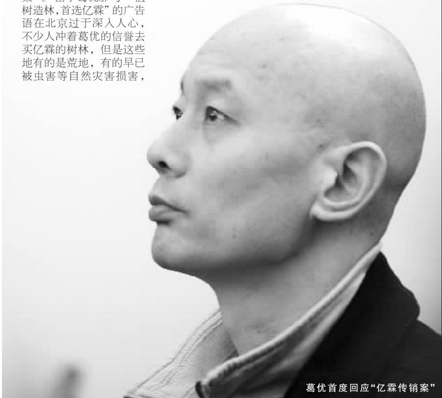
葛优首度回应“亿霖传销案”