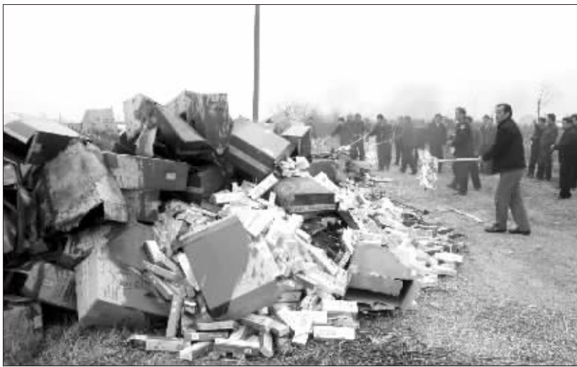
打假、维护消费者权益仍然任重道远 资料图片

昨天,在 2007 年江苏省 12315 消费维权工作新闻发布会上,江苏省工商局公布了 2006 年度十大打假维权典型案例。省工商局相关人士表示,和去年省消协公布的 2005 年十大案例相比,消费维权重点已经从单纯的商品质量投诉向服务领域倾斜,房地产、医疗领域维权力度加大。