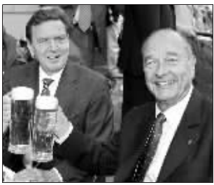
希拉克喜欢喝啤酒