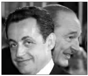
希拉克和“徒弟”萨科齐(左)