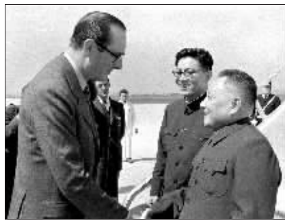
1975年5月,希拉克迎接邓小平副总理