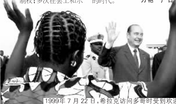
1999年7月22日,希拉克访问多哥时受到欢迎

勒庞 11 日批评希拉克是“法国历史上最糟糕的总统”。法国前总理法比尤斯也批评希拉克说:“对我来说,希拉克在位的时代对法国和欧洲而言,都是一个浪费时间的时代。” 万艳 广日