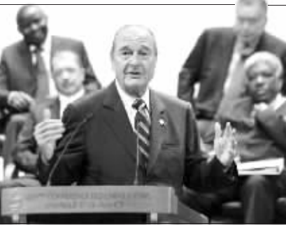
希拉克的外交政策受到广泛欢迎