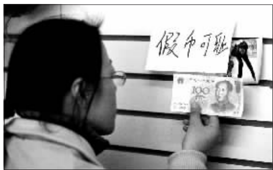
一进店门,就能看到这张假币

快报讯(记者 孙玉春实习生 周知)一张“百元大钞”赫然悬挂在店堂里,只不过它是张假钞,在假钞的上方还贴了一张纸条——“假币可耻”。