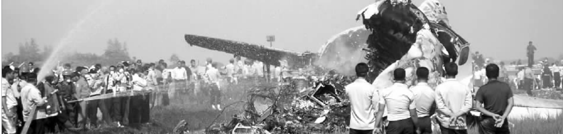
救援人员在着火的飞机旁喷水