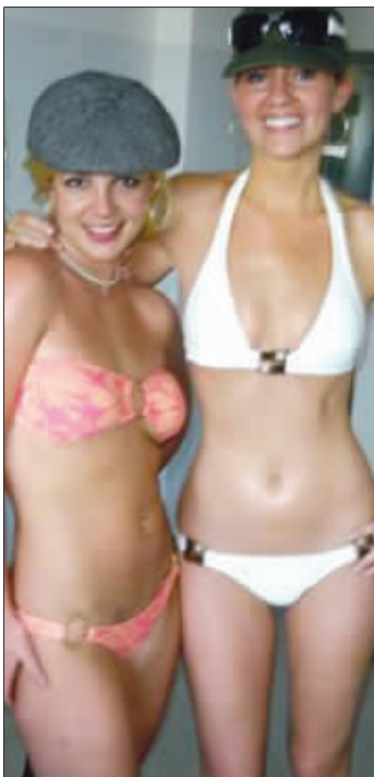
怪行①穿比基尼、戴假发

英国媒体4日爆料称,正在接受戒疗的布兰妮早前曾企图在戒疗所内上吊自杀。据知情人士透露:“布兰妮的情绪一度濒临崩溃,在自己的光头上写上666,然后更尝试以床单上吊自杀,幸好及时获医护人员阻止。”医生断言她的异常行为是因为患产后忧郁症。“小甜甜”接二连三发生状况,看来精神状态令人堪忧。