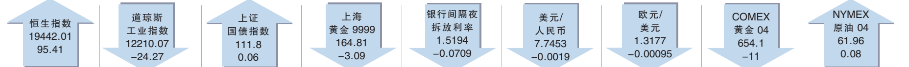
截至北京时间3月2日22:45