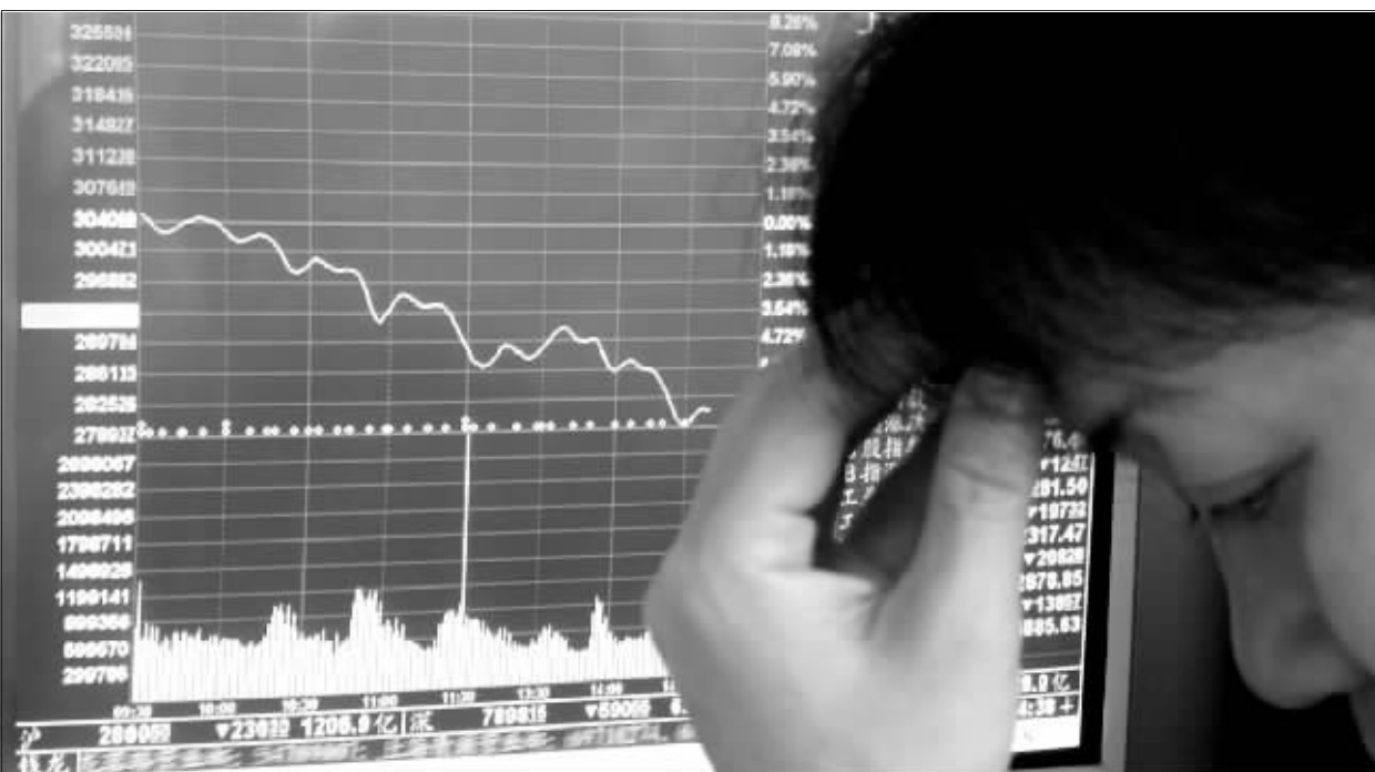
昨日,股市暴跌,股民黯然神伤

下跌268点 昨天,上证综指盘中最高上摸3049点,最低下探2763点,上下落差高达286个点,也创出了近10年行情的最大落差。 总市值“缩水”上万亿 据沪深证券交易所的数据,昨天的大跌让两市A股的总市值“缩水”10170.9亿元,两市A股的流通市值也减少了3008.1亿元。 860只个股跌幅达10% 周二市场出现了异常惨烈的杀跌走势,接近尾市之时,沪深两市共有860只个股跌幅达到10%,如果算上跌幅超过9%的,则沪深两市共有近1000家个股以近跌停的位置报收。