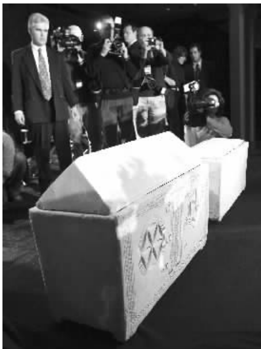
2007年2月26日,记者在纽约的新闻发布会上拍摄“耶稣尸骨盒”(左)。右上为导演詹姆斯·卡梅伦在新闻发布会上讲话。右下是“耶稣尸骨盒”。

声明中提到的这座千年墓地位于耶路撒冷郊区,由一个建筑队于1980年3月28日发现。根据考古学家L·Y·拉赫马尼出版的《耶稣尸骨目录》一书记载,考古学家随后在墓穴里发现了10个尸骨盒,其中5个盒上刻着的名字与《圣经新约》中的关键人物吻合,分别是耶稣、玛利亚、马太、约瑟和玛丽·玛格达莱妮(抹大拿的玛丽亚),还有一个盒子上刻有一