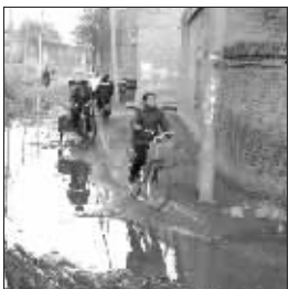
距濮阳县政府办公大楼不到两公里的落后村庄,污水横流(2月14日摄)。

河南省濮阳县是省扶贫开发重点县。然而,近几年来,这个县刮起了一股奢侈风:县委县政府及一些县直机关竞相建起豪华办公楼,这些单位的“头脑”们也纷纷搬进高档住宅。这股奢侈之风引起了当地群众的不满。