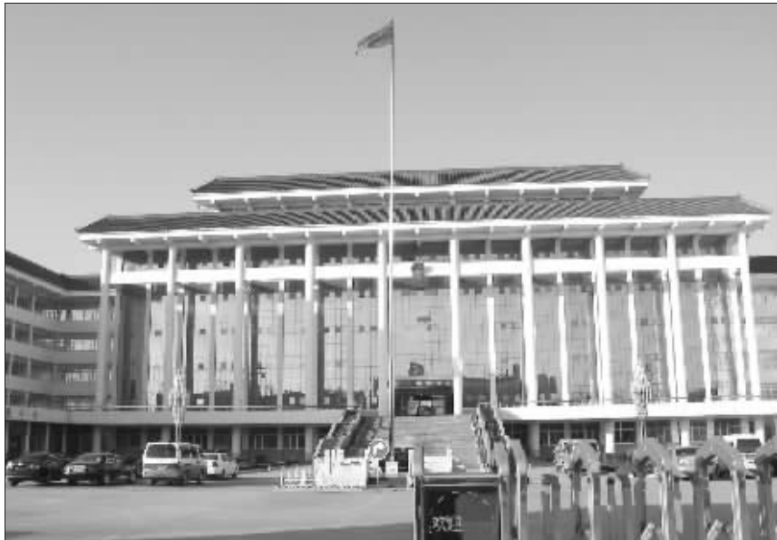
濮阳县委县政府综合办公大楼(2月14日摄)。