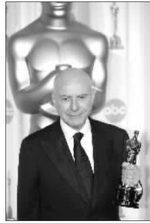
艾伦·阿金获最佳男配角奖