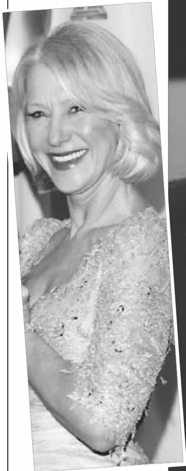
最佳女主角 海伦·米伦