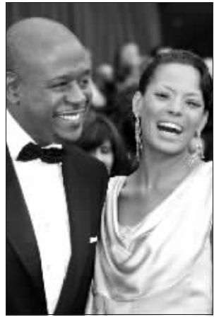
福里斯特·惠特克和妻子凯沙