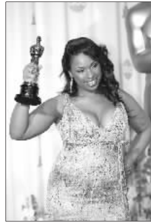
珍妮弗·赫德森手举奥斯卡奖杯