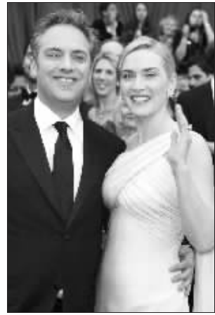
凯特·温斯莱特和丈夫萨姆