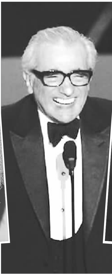
最佳男主角 福里斯特·惠特克

海伦·米伦似乎天生就是为塑造女强人而生的,她将女王的大家熟知的一面和不知道的内心应有的尊严,包括她对戴安娜之死的冷漠——一个正常女人,对前儿媳在媒体面前的所作所为尽可能的原谅。奥斯卡已多年没有拿得出手的女性人物传记片来炫耀,《女王》刚好填补这个空缺。