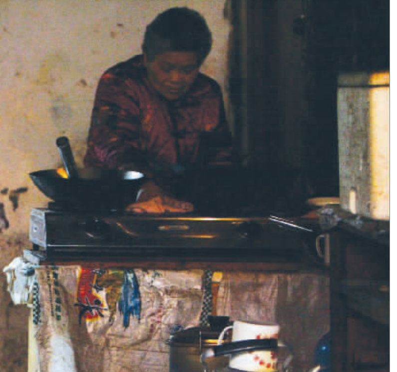
过完年，孩子们走了，“家”又恢复了往日的寂静。木屐巷7号68岁的万奶奶不免一番惆怅。