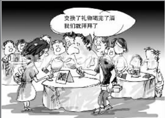
离婚宴——走出“坟墓”的新生之旅

昨天是春节后上班的第一天,就在很多人打起精神,重赴职场的时候,南京八城区的37对夫妻却选择在上上班的第一天,不去单位,而是先来到婚姻登记处,悄悄把婚给离了。据初步统计,这个离婚的数量比平日多出近1倍,又比去年同期多了15对。