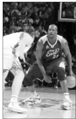
奥尼尔表演胯下运球

因为受伤,本该作为西部明星队首发中锋出场的姚明昨天只得坐在场边看着其他人的表演,不过这也给了他一次彻底放松的机会。看着这些和自己一起征战的全明星们在场上的各种表现,姚明也发出了最自然的笑容。