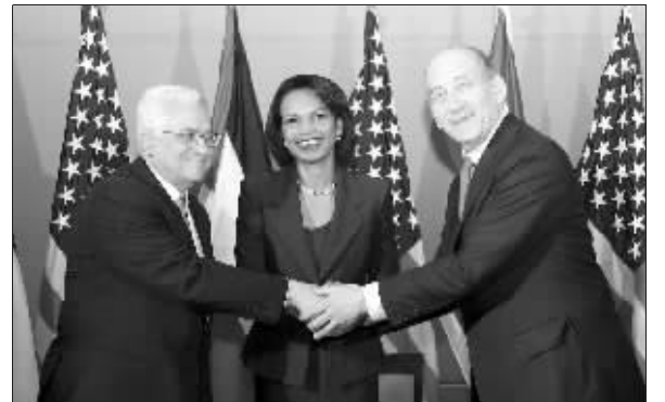
19日,美国国务卿赖斯(中)、以色列总理奥尔默特(右)和巴勒斯坦民族权力机构主席阿巴斯在耶路撒冷举行的三方会谈上握手。

新华社耶路撒冷2月19日电 美国国务卿赖斯19日在耶路撒冷与以色列总理奥尔默特和巴勒斯坦民族权力机构主席阿巴斯开始举行3方会谈,讨论推动中东和平进程问题。