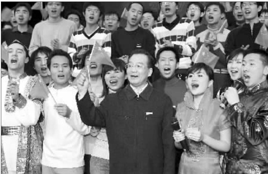
温家宝来到东北大学学生活动中心和留校学子共度除夕之夜

温家宝告诉大家:“农民的事,中央天天都在想。国家今年打算为农民做三件事:第一,全国农村孩子全部实行免费9年义务教育;第二,