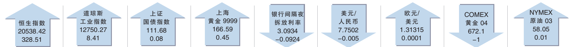
截至北京时间2月15日22:45