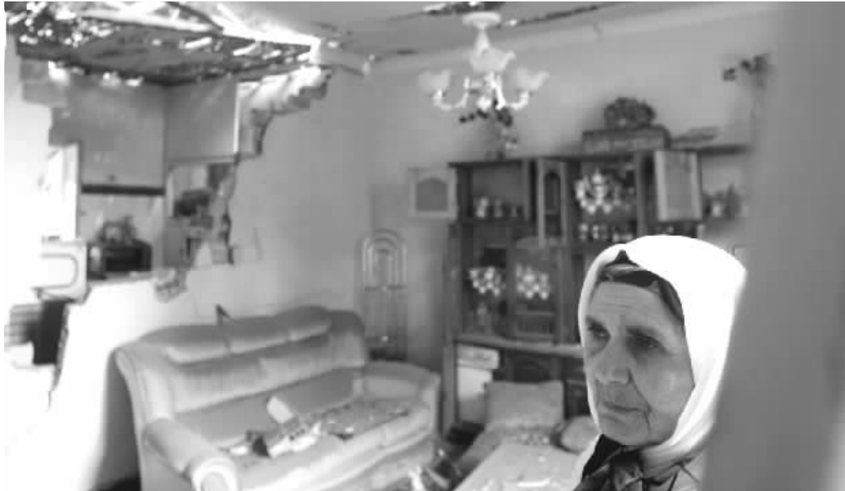
2月13日,在阿尔及利亚北部布米尔达斯附近的爆炸现场,炸弹专家和当地居民在查看遭到炸弹袭击的警察局