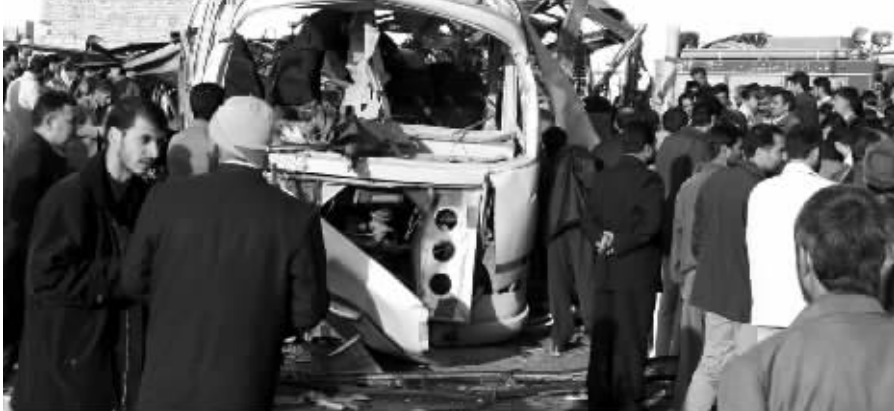
人们在发生爆炸的客车旁围观