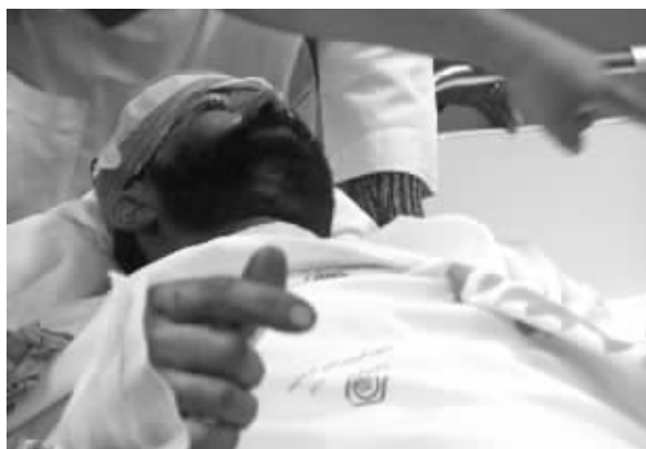
爆炸袭击事件中受伤的男子