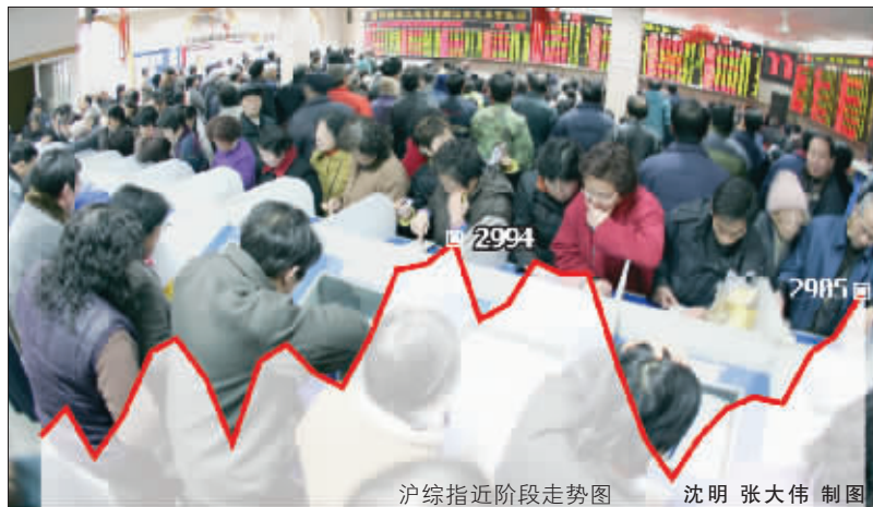
沪综指近阶段走势图 沈明 张大伟 制图

春节前的最后几个交易日,沪深股市也充满了节日的喜气。由于各路资金对节后行情逐步持乐观态度,因此纷纷入场抢“年货”。继前日深证综指创出历史新高之后,昨天沪深300指数也创出收盘新高,同时,上证综指收复2900点关口。核心权重股全面上涨成为昨天盘面的最突出特征,表明市场资金面以及人气在经受考验后重新稳定。