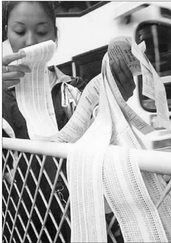
手机话费详单需有密码才能查询