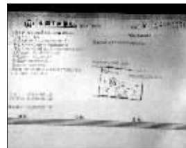
周瑞新出示的小球中心的汇款单复印件