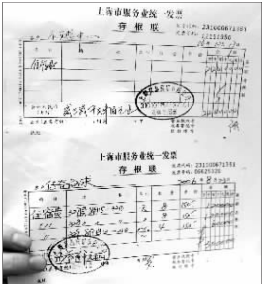
周瑞新出示的两张住宿发票的复印件