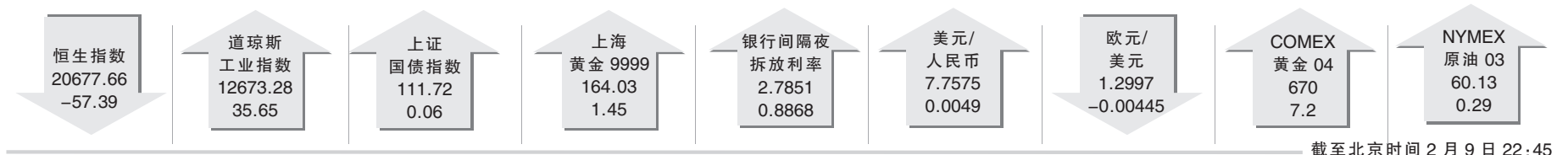
截至北京时间 2 月 9 日 22:45