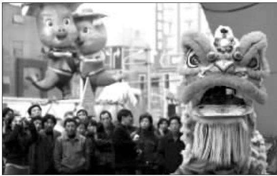
昨天，市民正在观看“舞狮”表演。春节的脚步越来越远，南京街头的年味也开始浓了起来