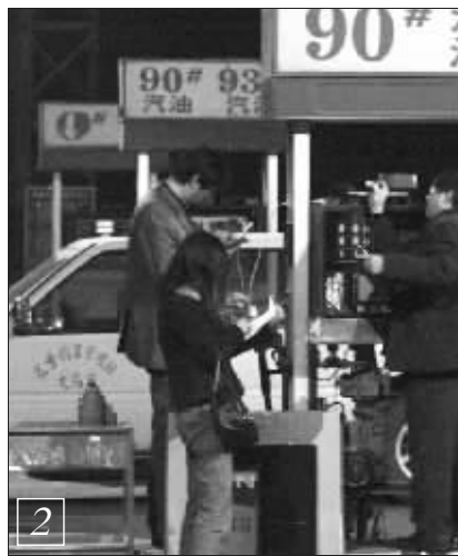
执法人员对加油机产生怀疑