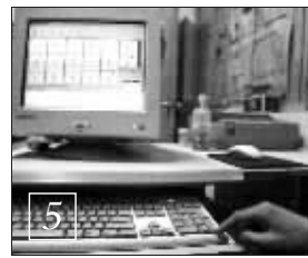
由这个电脑控制偷油