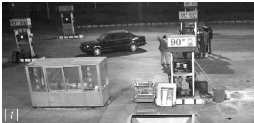
看似平常的加油站，却隐藏着不可告人的秘密