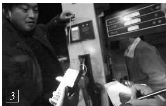
检查发现，加油机上显示的数字真的不准